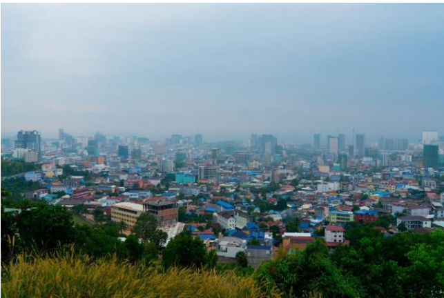
© អុង សំអាង, The Beloved Kampong som (កំពង់សោមជាទីស្រឡាញ់)