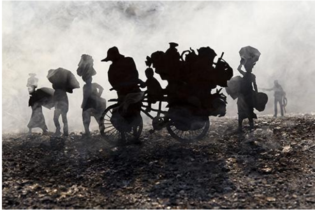
© ម៉ក់ វេមីស្យា, Left 3 Days